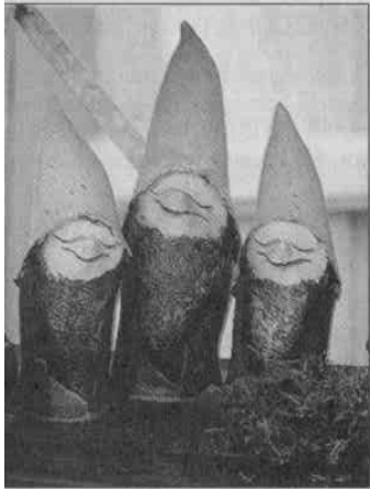
Der Organisator selbst den kleinen Kunstwerken gefiel die Atmosphäre.