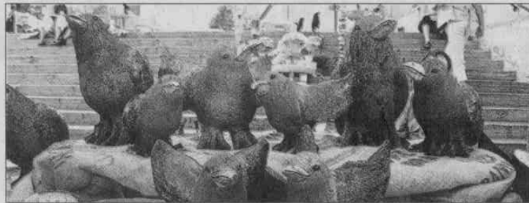
Zaungäste Die Vögel beobachteten das Geschehen in den Gassen.

Die Vielfalt der gezeigten Kunstobjekte am sechsten Kunstmarkt am Samstag in Zofingens Altstadt war beeindruckend. Da standen neben Skulpturen aus Metall, in die man viel hineininterpretieren konnte, ganz nüchterne Automobile des asiatischen Herstellers Daihatsu. Auch Anker-Nachbildungen wurden angeboten und bunt bemalte Holzstücke, die die Form eines Quaders hatten. Ron Dideldum schliesslich war mit einem riesigen Zauberhut präsent. (roa)