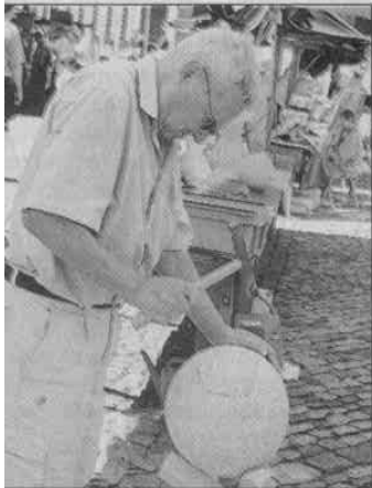
Handarbeit Einige Kunstwerke entstanden während des Marktes.